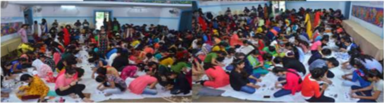
Ganesh Idol Making Workshop