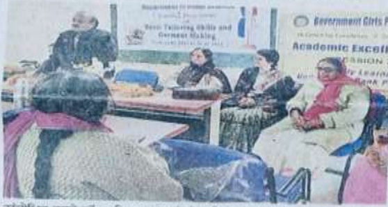
संबोधित करते डॉ. अनिजवाल एवं मंचासीन अन्य अतिथिगण।